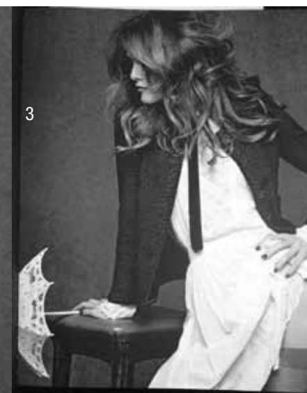
Fotografije iz knjige 'The Little Black Jacket', zajedničkog projekta Karla Lagerfelda i Carine Roitfeld: 1. Glumica Uma Thurman kao Marlene Dietrich. 2. Carine Roitfeld kao Coco Chanel. 3. Glumica Vanessa Paradis kao Jeanne Moreau. 4. Anne Wintour, urednica američkog Voguea, snimljena s leđa

Jesu li sin i kći naslijedili vaš kreativni talent?