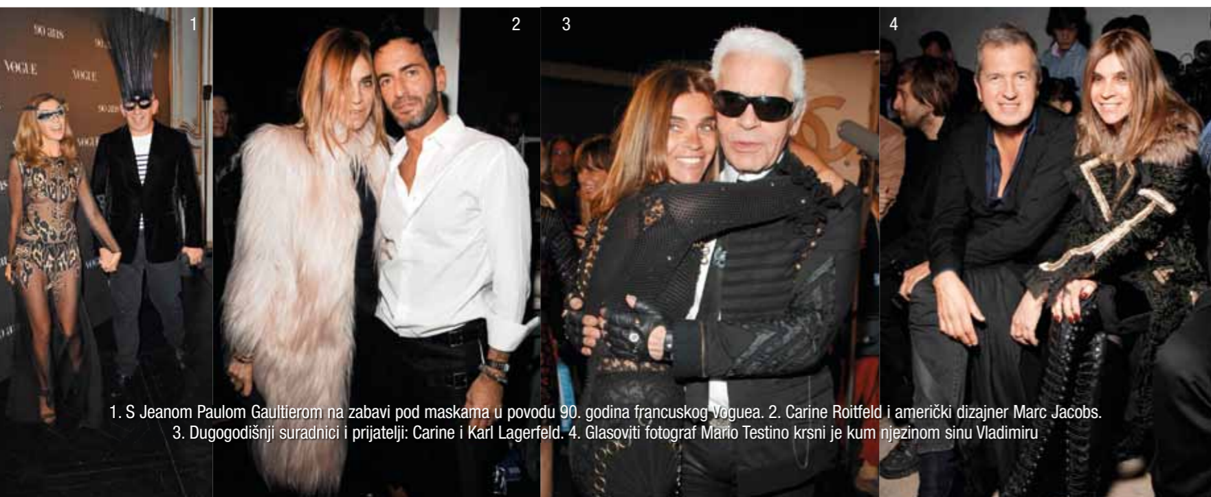
1. S Jeanom Paulom Gaultierom na zabavi pod maskama u povodu 90. godina francuskog Voguea. 2. Carine Roitfeld i američki dizajner Marc Jacobs. 3. Dugogodišnji suradnici i prijatelji: Carine i Karl Lagerfeld. 4. Glasoviti fotograf Mario Testino krsni je kum njezinom sinu Vladimiru

- Nosite visoke potpetice kad želite izgledati ženstveno! Crno je znak elegancije i primjereno je ozbiljnijim ženama. Odiđevajte se u skladu s godinama - nikad ne nosite ono što pristaje vašoj kćeri. Torbe i cipele nikad ne mijenjam sezonski, ne volim kad su nove, nego tek kad dobiju malo patine. Volim odjeću, ali nisam njome opterećena: ljudi koji slijepo prate modu i kupuju trendovske komade obično nisu nimalo šik. □