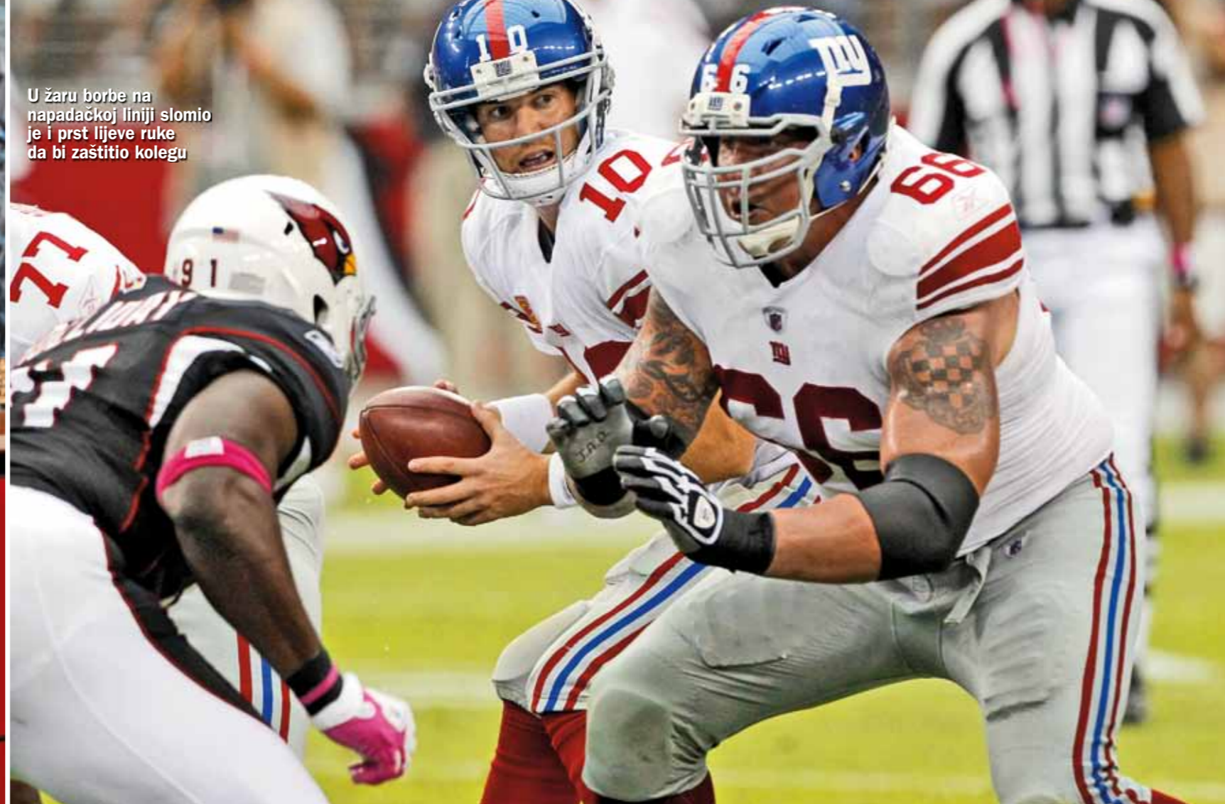
U žaru borbe na napadačkoj liniji slomio je i prst lijeve ruke da bi zaštitio kolegu

Napisala Marijana Marinović