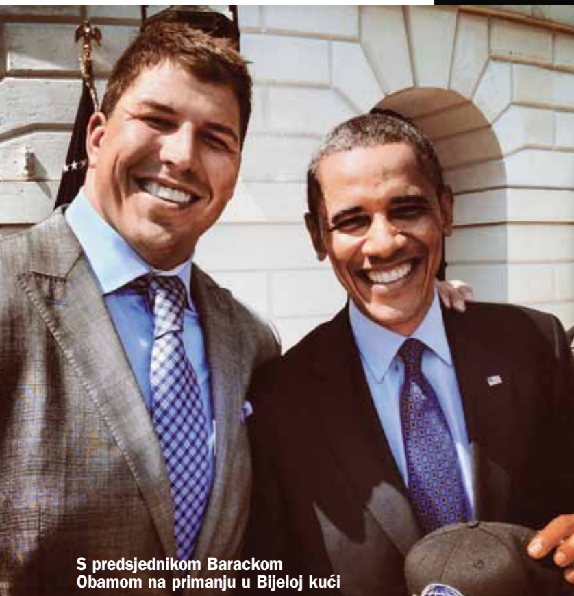
S predsjednikom Barackom Obamom na primanju u Bijeloj kući

Od djetinjstva sam se naučio boriti za sebe, taj duh zadržao sam i danas na terenu, a uvijek se sjetim i riječi pokojnog oca: ako nemaš strasti i predanosti u srcu, ništa nećeš postići