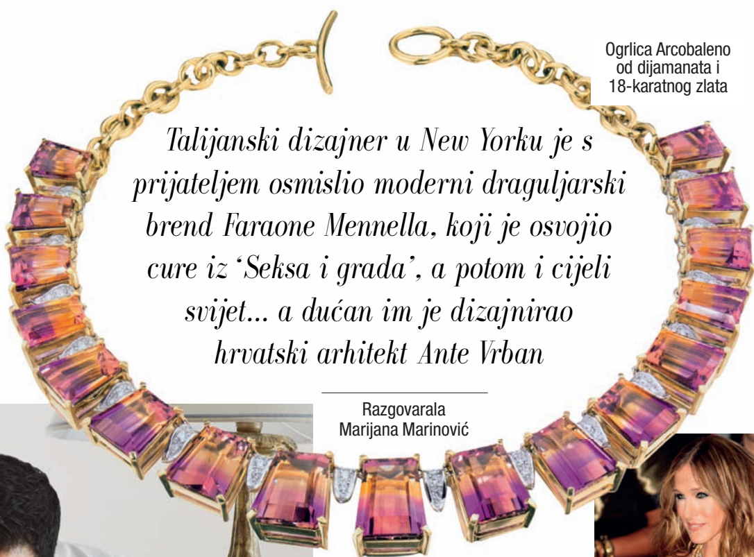
Ogrlica Arcobaleno od dijamanta i 18-karatnog zlata