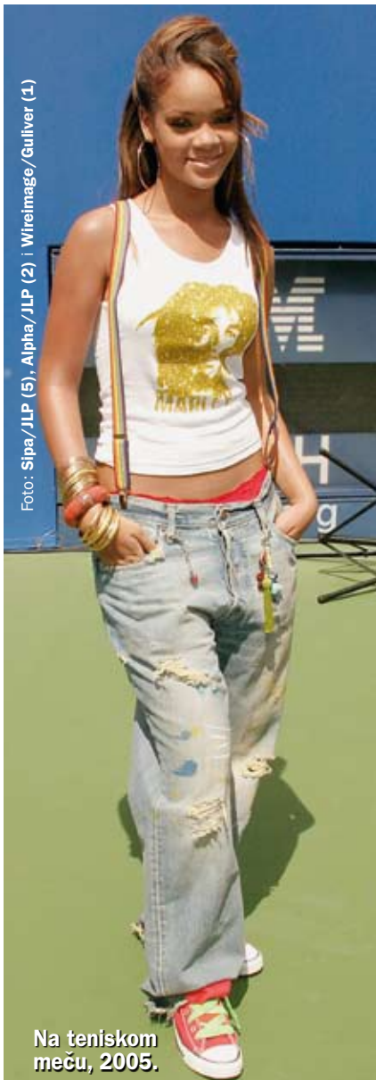
Na teniskom meću, 2005.