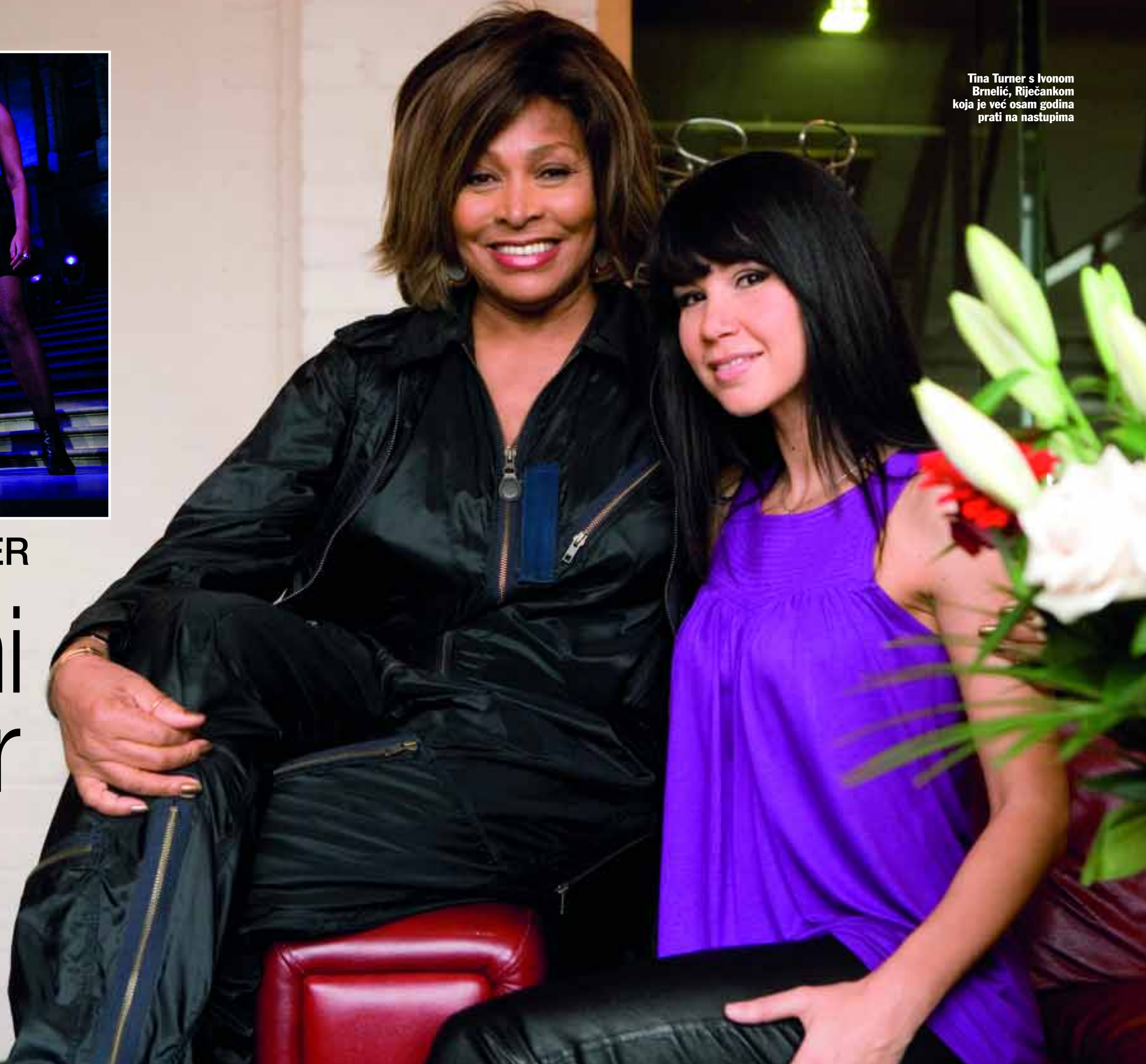
Tina Turner s Ivonom Brnelić, Riječankom koja je već osam godina prati na nastupima

Američka pjevačica, koja je prošli vikend u Londonu pjevala na humanitarnom balu za koji je ulaznica stajala 30 tisuća funta, otkriva zašto i u 67. godini nosi minice te kako je danas najviše veseli uređivati svoja tri doma - u Švicarskoj, Francuskoj i Engleskoj