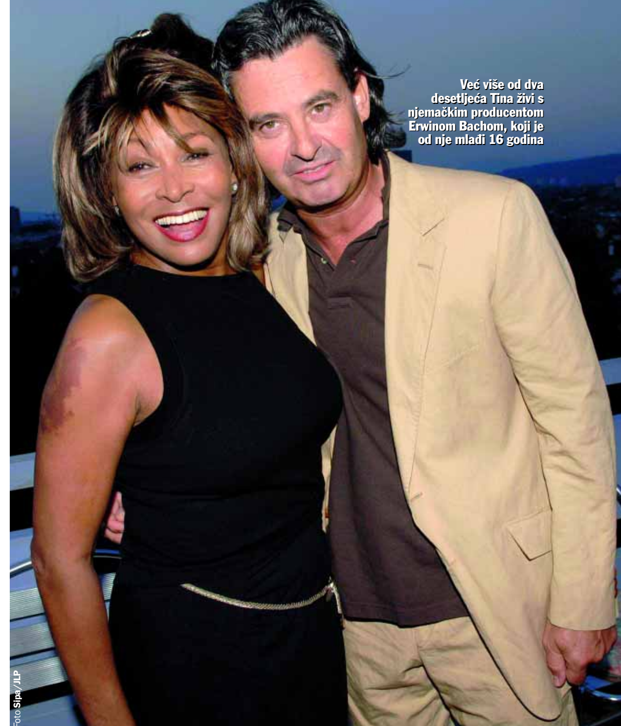
Već više od dva desetljeća Tina živi s njemačkim producentom Erwinom Bachom, koji je od nje mlađi 16 godina

U dvorani u kojoj je nastupala Tina Turner sa svojih pet pratećih pjevačica i plesačica, među kojima je bila i 35-godišnja Riječanka Ivona Brnelić, bili su postavljeni stolovi za deset osoba, a nad svima je "bdio" kostur dinosaura. Upravo zbog eksponata iz stalnog muzejskog postava, koji nije bilo moguće seliti, organizatori priredbe odlučili su da dekoracija prostora bude u stilu crtića "Obitelj Kremenko". Tako su stolnjaci bili tigrastog uzorka, hostese su se šetale u suknjicama i topićima u stilu kamenog doba, a uzvanici